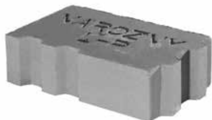
bloczek narożny P+W 380 x 240 x 120