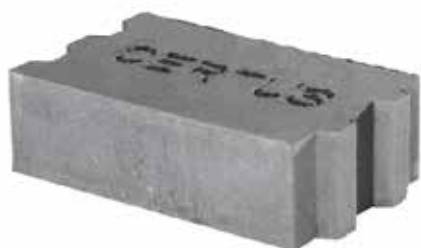
bloczek P+W 380 x 240 x 120