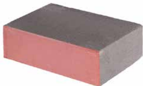
bloczek BF01 380 x 240 x 120